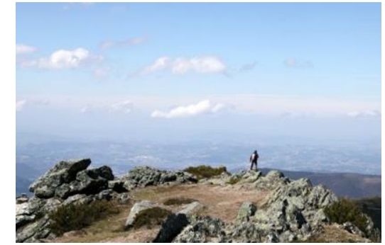
[Belvédère de Nossa Senhora de Moreira]